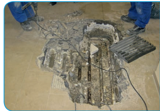
Bild 7 | Die Heizungsrohre sind innerhalb der Wärmedämmung korrodiert.

wurde keine Trocknung veranlasst. Die Entscheidung über möglicherweise erforderliche Trocknungsmaßnahmen aus „bautechnischer oder bauphysikalischer Sicht“ wurde der Bauleitung zugewiesen, die das ablehnte, da doch die verzinkten Stahlrohre korrosionsgeschützt wären! Die vollkommen falsche Bewertung des Folgerisikos lässt erkennen, dass dem Protokollführer die Korrosionsprozesse nicht geläufig waren. Zum damaligen Zeitpunkt hätte mit einer schnellen technischen Trocknung die Außenkorrosion sicher vermieden werden können. Möglicherweise hätte der Rohrkanal geöffnet werden müssen. Verantwortlich für die Nichtdurchführung der Trocknungsmaßnahmen ist die damalige Bauleitung. Aufgrund der fortgeschrittenen Außenkorrosion und der Feuchtesättigung der Rohrdämmung mussten die Heizungsrohre vollständig erneuert werden.