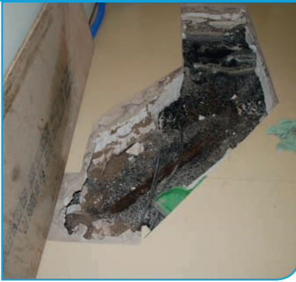
Bild 8 | Geöffneter Bodenkanal mit den direkt ohne zusätzlichen Korrosionsschutz eingebetteten Rohren der Heizungsinstallation. In dem Bodenkanal liegen auch die Rohre der Trinkwasserinstallation.