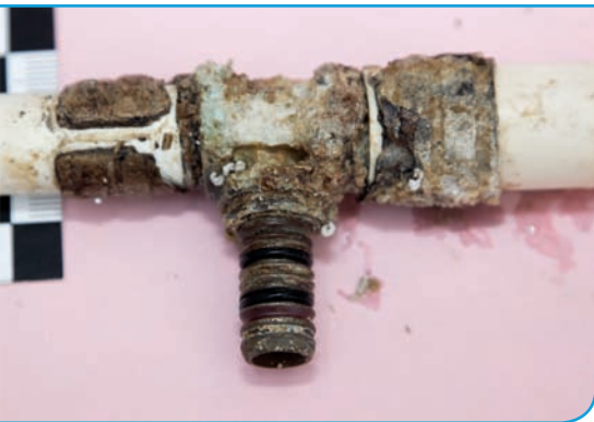
Bild 5 | Detail des schadenauslösenden T-Stücks. Auf dem Stützkörper sind beide O-Ringe vorhanden. Die korrodierten Presshülsen sind bereits gerissen. Eine kraftschlüssige Verbindung ist damit nicht mehr gegeben.

hung der Bodenabdichtung in den Verlegebereich der Trinkwasserleitungen. Ob darüber hinaus auch Undichtigkeiten in der „weißen Wanne“ zu einem „Feuchtebeitrag“ geführt haben, ist zusätzlich strittig. Die einzelnen Rohrleitungen sind mit Dämmschläuchen ummantelt, die an den Stoßstellen untereinander nicht verklebt waren. Unter mehrjähriger Einwirkung der