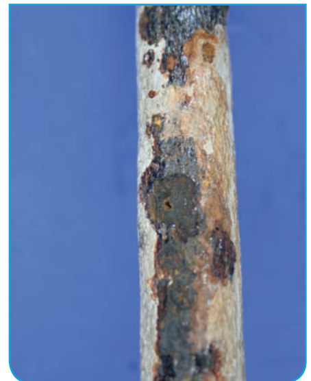
Bild 12 | Die Wanddurchbrüche befinden sich in den Heizungsrohren immer unterhalb der Ausgleichsmasse. Die angrenzenden Pressverbindungen sind dicht und mangelfrei. Außerhalb der Ausgleichsmassen sind die Rohre blank.

gen konnte zweifelsfrei ausgeschlossen werden – die Rohre und Fittings waren blank und wiesen keine Merkmale eines Wasseraustritts auf ( Bild 12 ). ▶