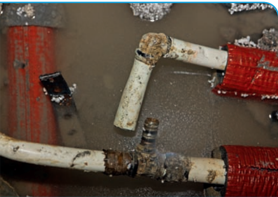
Bild 4 | Detail der getrennten Pressverbindung. Die Presshülse ist nicht mehr vorhanden! Die äußeren Verformungen des Mehrschichtverbundrohres zeigen jedoch an, dass sich dort ursprünglich eine Presshülse befunden hat.

verlegt. Dieser Ausgleichsestrich ist direkt auf den Beton der „weißen Wanne“ der äußeren Gebäudehülle aufgebracht. Die Innenwände des Untergeschosses sind in Leichtbauweise ausgeführt und stehen ebenfalls direkt auf der Betonsohle. Die Zuleitungen zu den Duscharmaturen sind in den Leichtbauwänden geführt. Die Armaturen sind nicht bzw. nur unvollständig gegen Spritzwasser abgedichtet. Das „Plansch“wasser gelangte unter Umge-