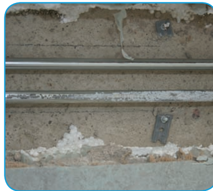
Bild 10 | Freigelegter Heizkörperanschluss mit der eingedrungenen Ausgleichsmasse bis zum abweigenden T-Stück. Die dunklen Bereiche in der hellgrauen Masse sind korrodierte Stellen.

nicht geeignet ist, Feuchtigkeit von den Rohren fernzuhalten. Bei fachgerechter Erstellung des Bodenkanals hätte das aus der gebrochenen Verbindung der Trinkwasserleitung ausströmende Wasser trotz fehlender Wärmedämmung die Heizungsrohre nicht von außen angreifen können, da es schadenfrei abgefließen wäre. Die unsachgemäße Ausführung des Bodenkanals liegt nicht im Verantwortungsbereich des Sanitärinstallateurs, sondern