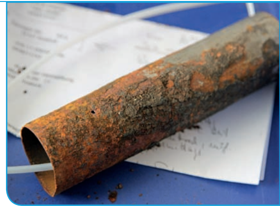
Bild 6 | Ausgebautes Rohrstück: Die Korrosion ist ausschließlich von außen erfolgt. Innen ist das Rohr glatt und weist keine lokalen Korrosionsstellen auf.

In einem neu errichteten Gebäude ist es innerhalb kurzer Zeit zu mehreren Rohrbrüchen in der Heizungsinstallation durch Außenkorrosion gekommen ( Bild 6 ). Die Rohre aus C-Stahl sind in einem mit Bitumenpappe ausgekleideten Rohrkanal in der Betonsohle des nicht unterkellerten Gebäudes verlegt worden. Bei der Fertigstellung des Fußbodens ist der Bodenkanal mit Perlite aufgefüllt worden ( Bild 7 ). Die erforderliche Feuchtigkeit für die Außenkorrosion ist durch Regenwassereinträge während der Bauphase an die Rohrleitungen gelangt. Aus den Bauunterlagen geht hervor, dass diese Regenwassereinträge von der Bauleitung vollkommen falsch eingeschätzt worden sind. Obwohl sogar davon ausgegangen wurde, dass sich das Wasser „vorzugsweise in den Installationskanälen verteilt haben wird“,