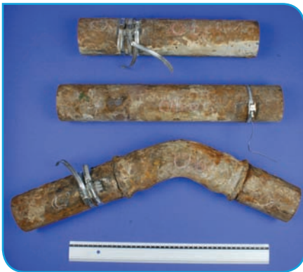
Bild 9 | Die schadenursächlichen Stahlrohre im zugesandten Zustand. Die Rohre sind außen stark korrosiv geschädigt. Mit den Schellen wurden die aufgetretenen Leckagen am Schadenort für den zeitweiligen Betrieb provisorisch abgedichtet.

stand von nur wenigen Wochen zwei Wasserschäden festgestellt worden. Der erste Schaden war in der Trinkwasserinstallation durch eine gebrochene Steckverbindung verursacht worden. Der zweite Schaden trat in der Heizungsinstallation auf. Beide Schadenorte liegen ca. 50 m weit auseinander. Aber beide Rohrleitungen sind im selben Bodenkanal verlegt und dieser Bodenkanal ist mit einer Perlite- stellenweise auch Sandschüttung gefüllt ( Bild 8 ). Eine Wärmedämmung der Rohre oder ein anderer äußerer Korrosionsschutz ist nicht vorhanden. Die C-Stahlrohre der Heizungsinstallation sind wie schon die Rohre im dritten Beispiel durch Außenkorrosion geschädigt ( Bild 9 ). Von außen sind im Bereich der Wanddurchbrüche kraterähnliche Vertiefungen vorhanden, während die Rohrwand glatt und nur mit einer dünnen Deckschicht versehen sind. Schadenursächlich sind der fehlende Korrosionsschutz der Stahlrohre sowie die Ausführung des Bodenkanals, der konstruktiv aufgrund der Füllung mit Sand und Perlite