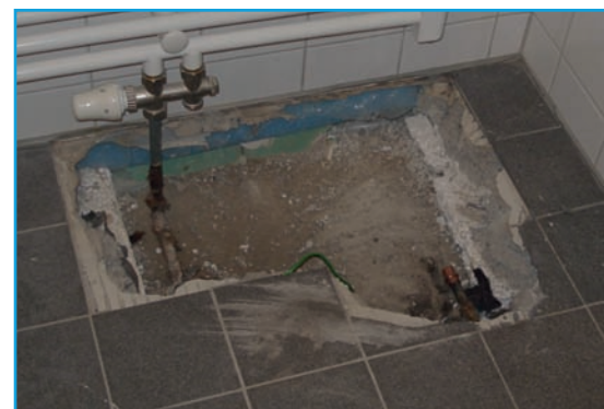
Bild 2 | Beispielhafte Einbauposition der Heizungsrohre in den Badezimmern.