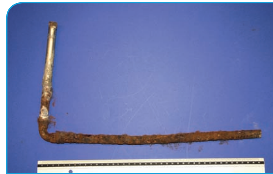
Bild 1 | Der Heizungsrohabschnitt nach Entfernen des Dämmmaterials: Der im Fußboden verlegte Teil ist stark korrodiert. Die Korrosion nimmt mit zunehmender Entfernung vom Durchstoßpunkt im Fußboden ab.

Beispiel 2: Korrodierte Presshülsen von Trinkwasserleitung durch Planschwasser im Spa-Bereich eines Hotels Im Untergeschoss des Hotels wurden meh-